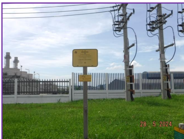
ป้ายเตือนแนวท่อส่งก๊าซ บริเวณโรงงาน