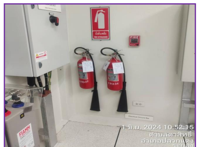
ถังดับเพลิงบริเวณท่อส่งก๊าซ

ภาพที่ 3.2-17 ภาพถ่ายระบบรักษาความปลอดภัยตามแนวท่อส่งก๊าซฯ และบริเวณสถานีก๊าซฯ ของโครงการทอส่งก๊าซธรรมชาติไปยังโรงไฟฟ้าตาสีห์ 4 โรงไฟฟ้าตาสีห์ 3