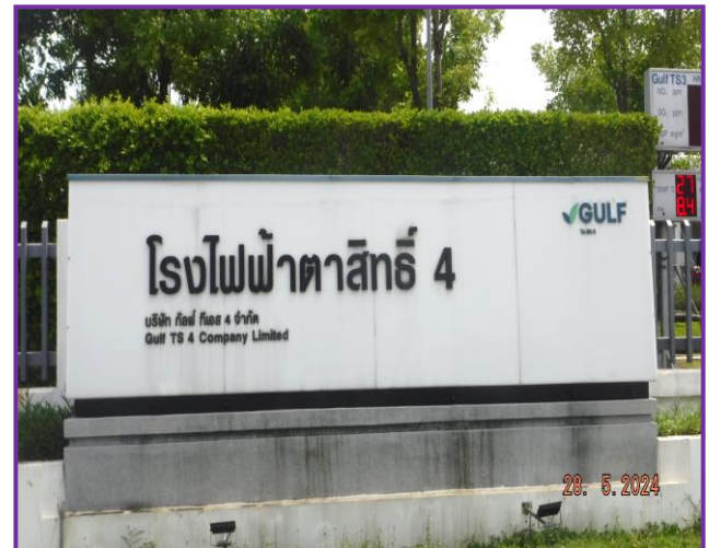
บริเวณด้านหน้าโรงงาน