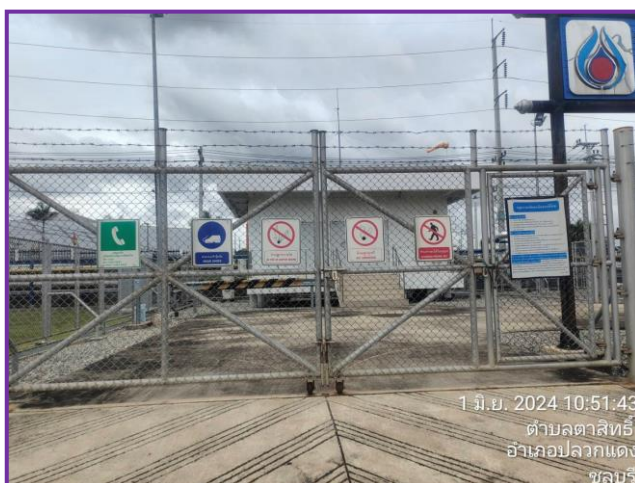
ป้ายเตือนต่าง ๆ บริเวณสถานีควบคุมความดันก๊าซ (MRS)