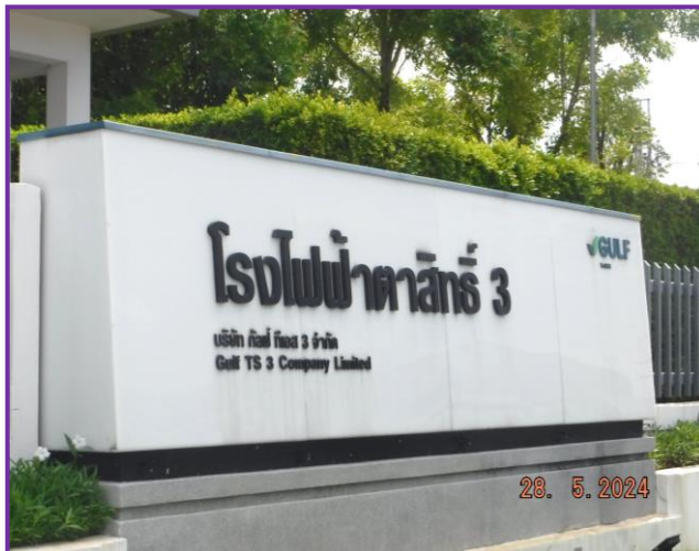
บริเวณด้านหน้าโรงงาน