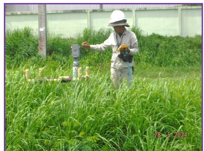
พนักงานสวมใส่ชุด PPE